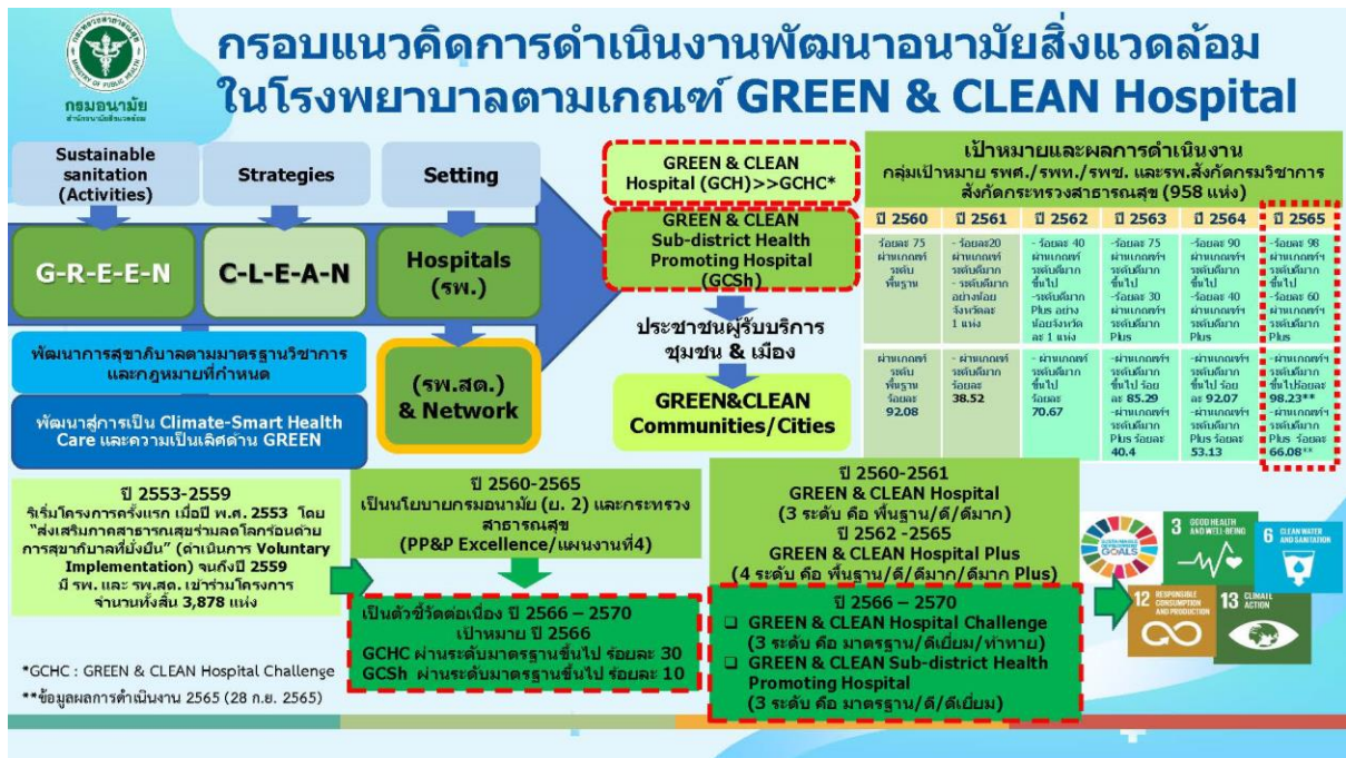
ภาพที่ 1 กรอบแนวคิดการดำเนินงานการพัฒนาอนามัยสิ่งแวดล้อมในโรงพยาบาลตามเกณฑ์ GREE & CLEAN Hospital